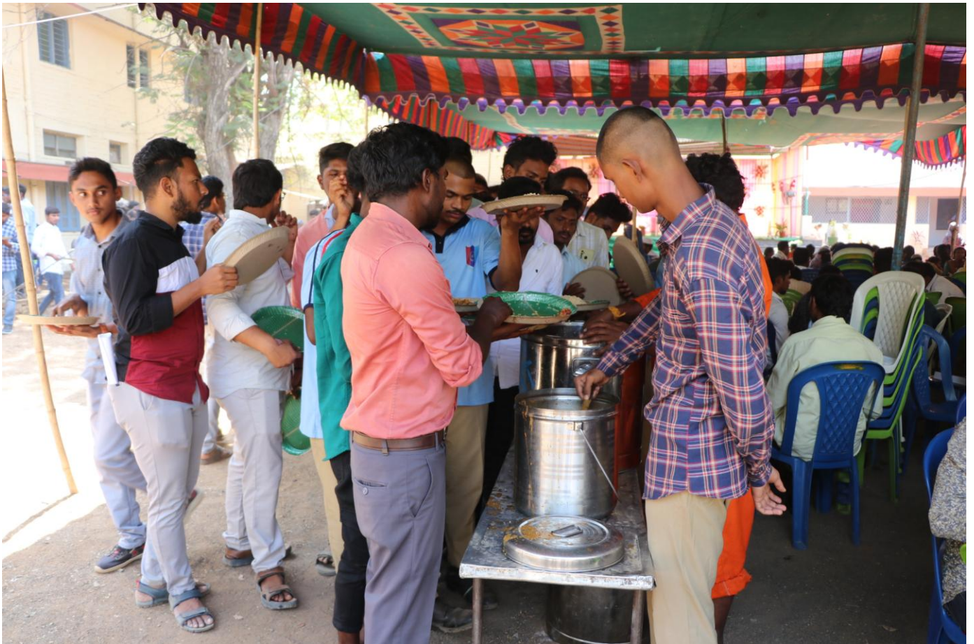
Arranged the Lunch to the Students who are attended from mapped Govt. Colleges of NRC: