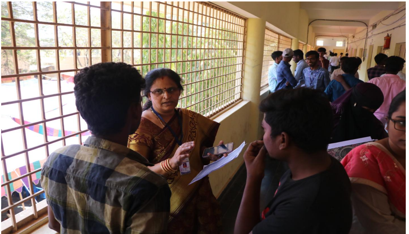
Block wise incharges facilitating the students to attend the interviews for various companies