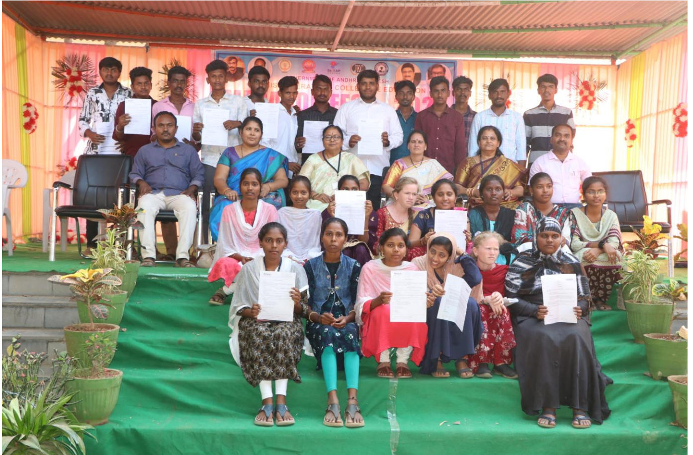
Offer Letter distributed to the selected students pertaining to the various colleges